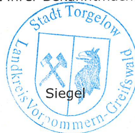
Kerstin Pukallus Bürgermeisterin

Anlage: Umgriff Sanierungsgebiet mit Stand September 2025